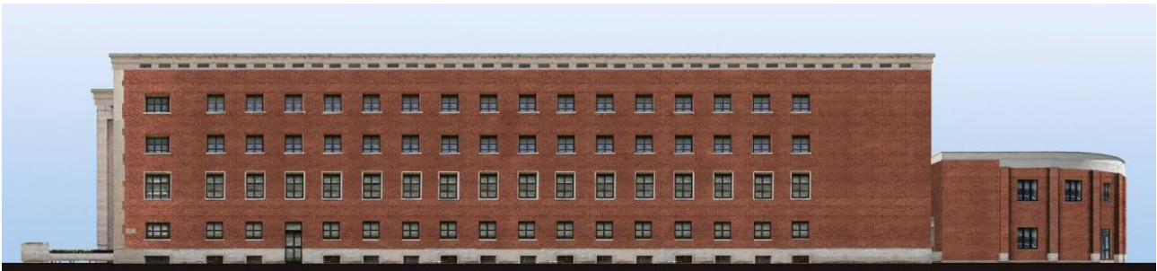
Prospetto su via Cialdini: stato attuale e stato di progetto

Le facciate interne dell'edificio, invece, completamente rivestite in lastre di travertino in diverse dimensioni e spessori, saranno oggetto di attenta conservazione, limitando al minimo qualsiasi intervento di rimozione e provvedendo ad una generale opera di pulizia e ripristino, come indicato negli specifici elaborati di restauro.