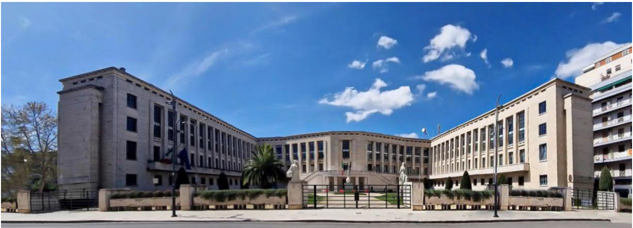
Prospetto frontale: stato attuale e stato di progetto con l'inserimento dei nuovi cancelli