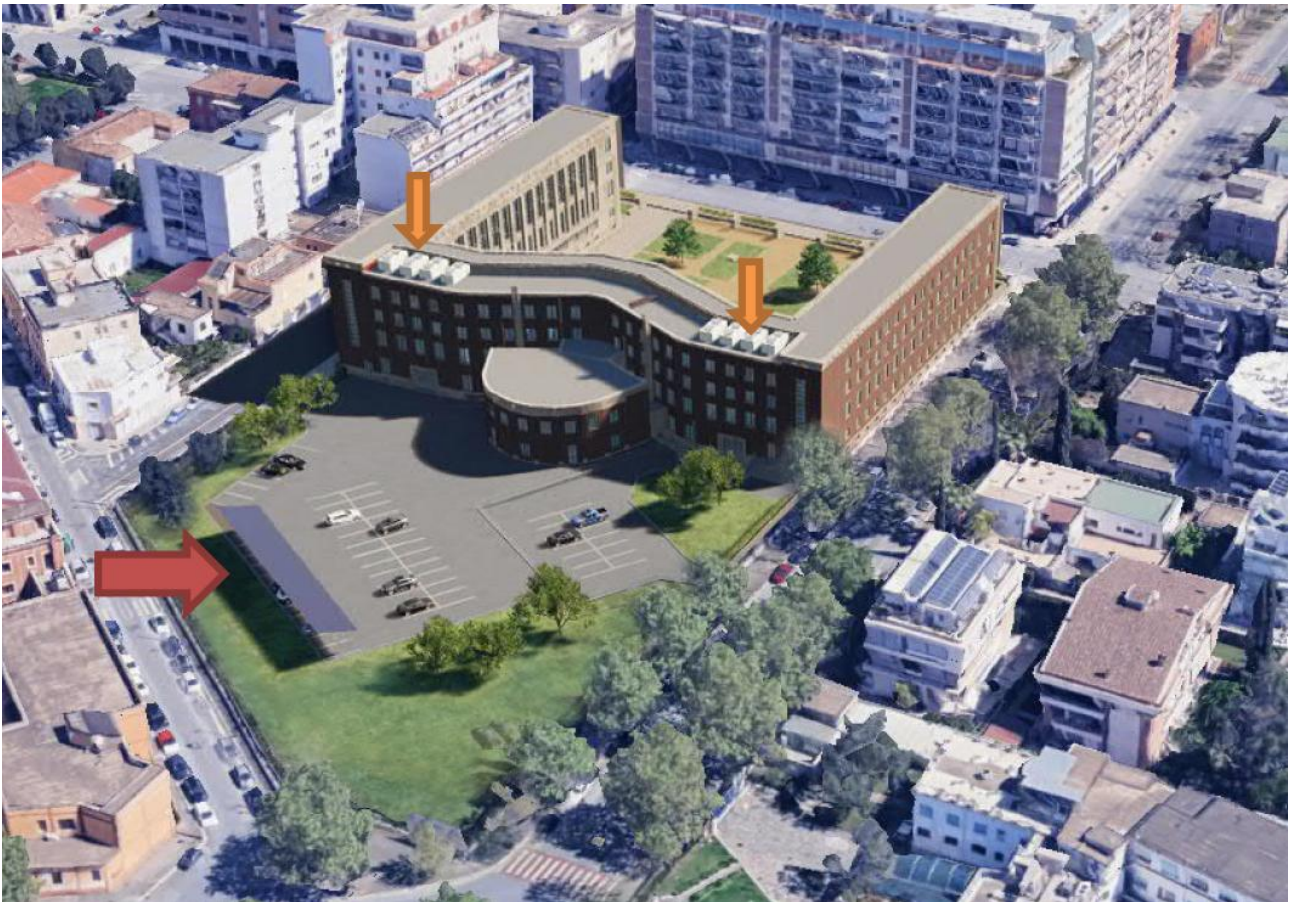
Vista aerea: stato di progetto, con indicata la posizione delle unità CDZ esterne e della pensilina fotovoltaica