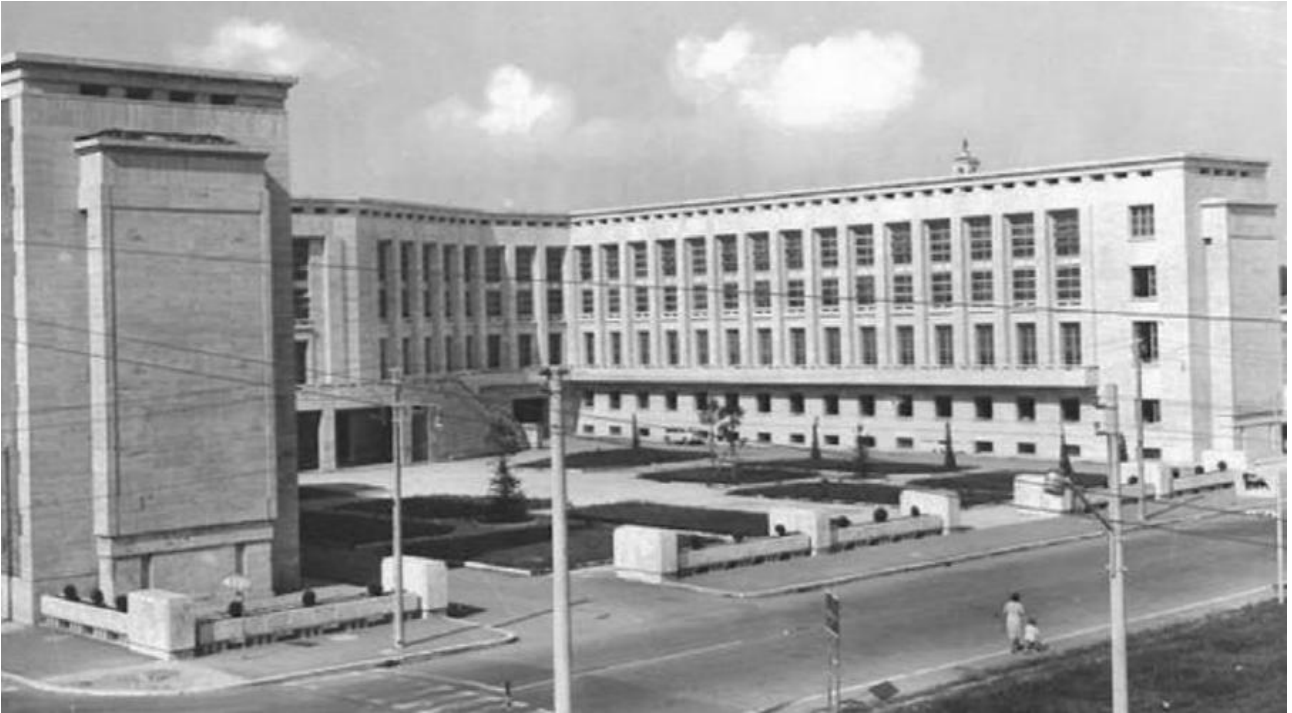
Palazzo M alla fine degli anni '50

Nel 1996 il piazzale interno venne dedicato ad Araldo di Crollalanza, con la posa di tre statue: della Madre Rurale e della Portatrice di Pane (recuperate dalla ex-casa del contadino demolita nel '39), e di Giuseppe Giuliano, studente ucciso nel 1971.