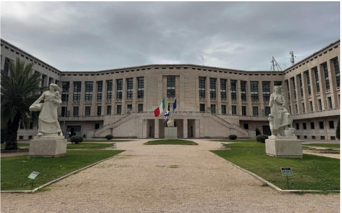
Stato attuale: parte centrale del cortile interno