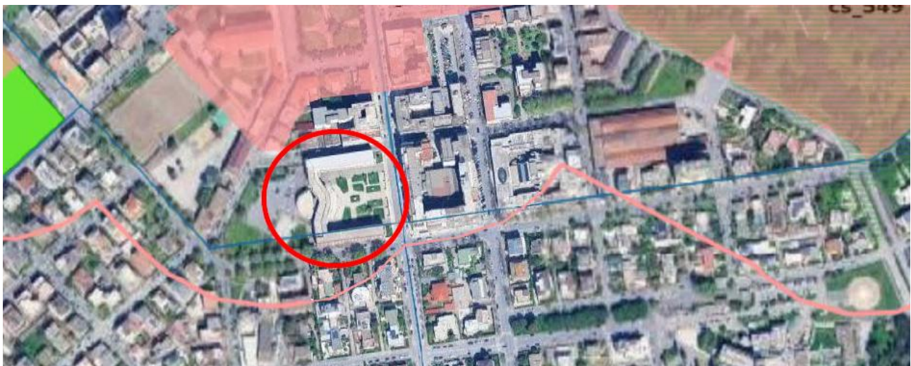
PTPR – Beni ricognitivi di piano, fascia di rispetto