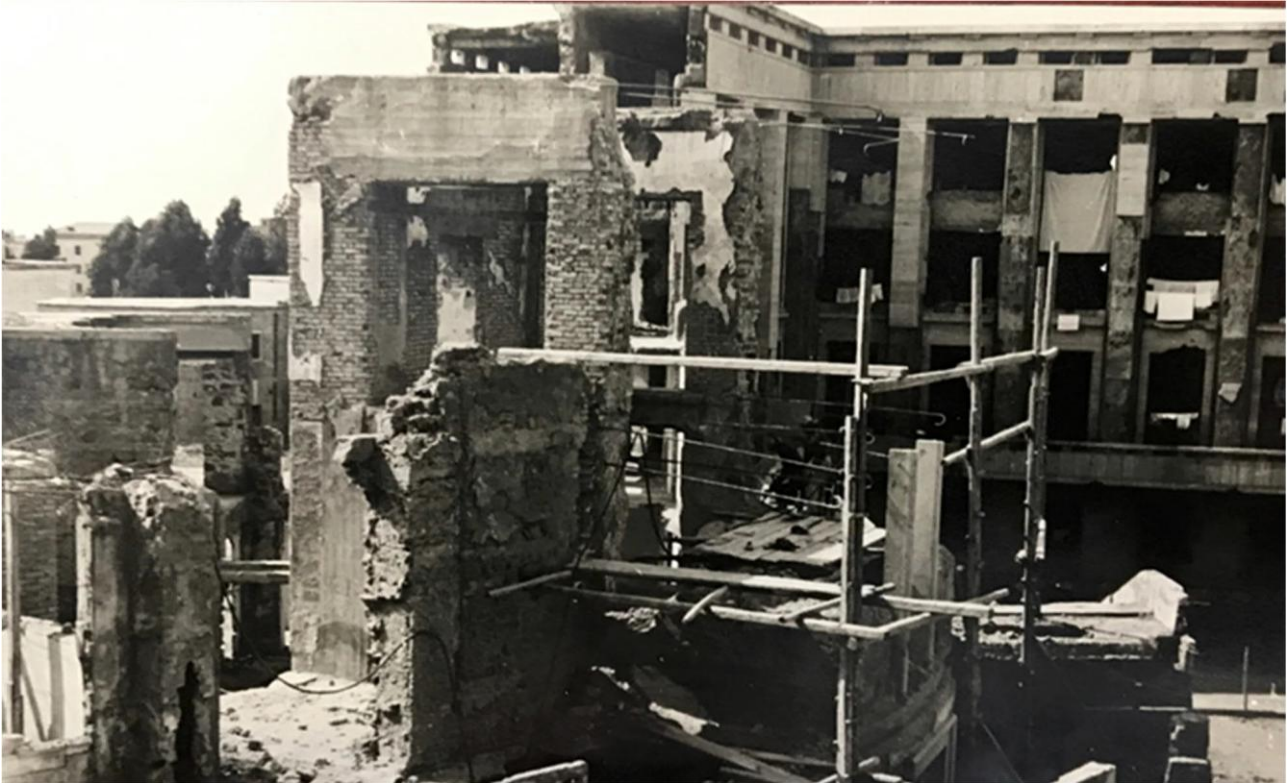
Il corpo ad emiciclo con il residuo della torre e della scalinata monumentale a seguito dei bombardamenti del 1944

Le foto d'archivio successive ai bombardamenti, mostrando l'edificio con murature e strutture al vivo, permettono l'identificazione di alcuni elementi costruttivi e delle tipologie di murature.