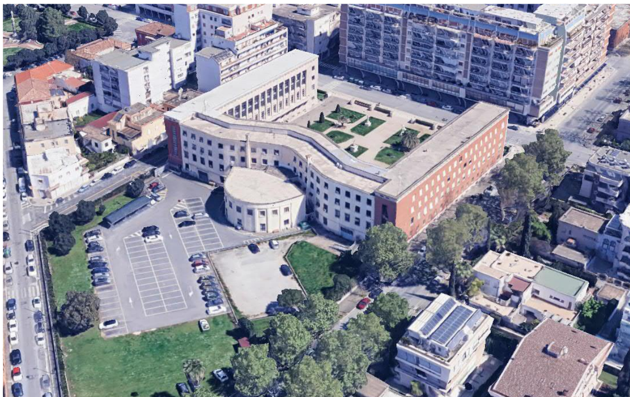
Vista aerea: stato attuale

La dotazione impiantistica dell'edificio verrà completamente rinnovata, pertanto si prevede la totale sostituzione dell'impianto elettrico, degli impianti idricosanitari, di scarico e dell'impianto di condizionamento. Si prevede inoltre la realizzazione di un impianto di ventilazione meccanica e di un impianto di sicurezza antincendio. Tutti gli interventi previsti tengono conto della morfologia complessiva dell'edificio, e non comportano modifiche sostanziali all'impianto planimetrico originario. Si prevede la sostituzione dei due ascensori attuali e la realizzazione di due nuovi ascensori all'interno dei vani scala di nuova costruzione. Nel cortile/parcheggio posteriore verranno installate pensiline fotovoltaiche, posizionate lontano dall'edificio al fine di non alterarne la leggibilità volumetrica e permettendo di integrare questa nuova dotazione impiantistica nel modo meno invasivo possibile. Le esigenze di adeguamento impiantistico prevedono l'installazione in copertura di pompe di calore. Si prevede il posizionamento agli angoli della porzione di copertura più bassa, in modo da non eccedere con l'ingombro delle macchine dalla sagoma della copertura, e di minimizzare l'impatto visivo delle nuove apparecchiature, come evidenziato nel fotomontaggio che segue: