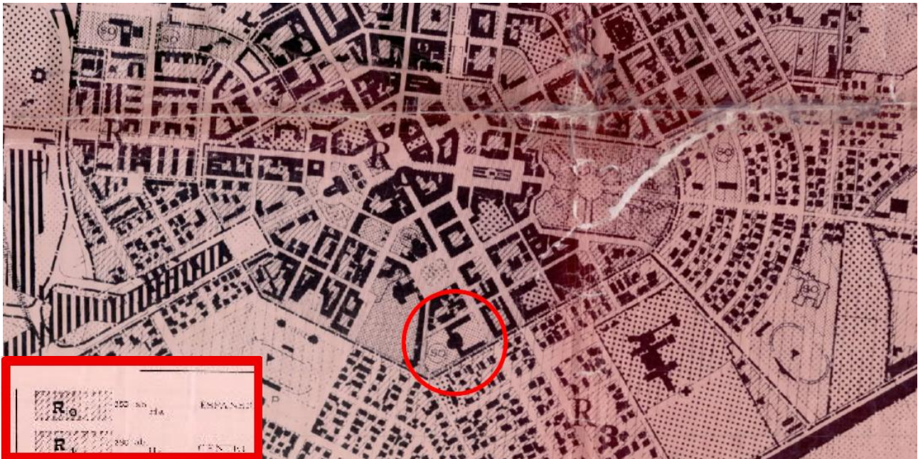
Stralcio PRG di Latina

"4. La fascia di rispetto si estende per una profondità di centocinquanta metri a partire dalla perimetrazione del bene accertata come indicato nel precedente comma; all'interno della perimetrazione di tale fascia, ogni modificazione dello stato dei luoghi è sottoposta all'autorizzazione di cui all'articolo 146 del Codice, fatte salve le ipotesi di cui all'articolo 149 del Codice stesso, nel rispetto delle prescrizioni di cui ai commi da 13 a 17."