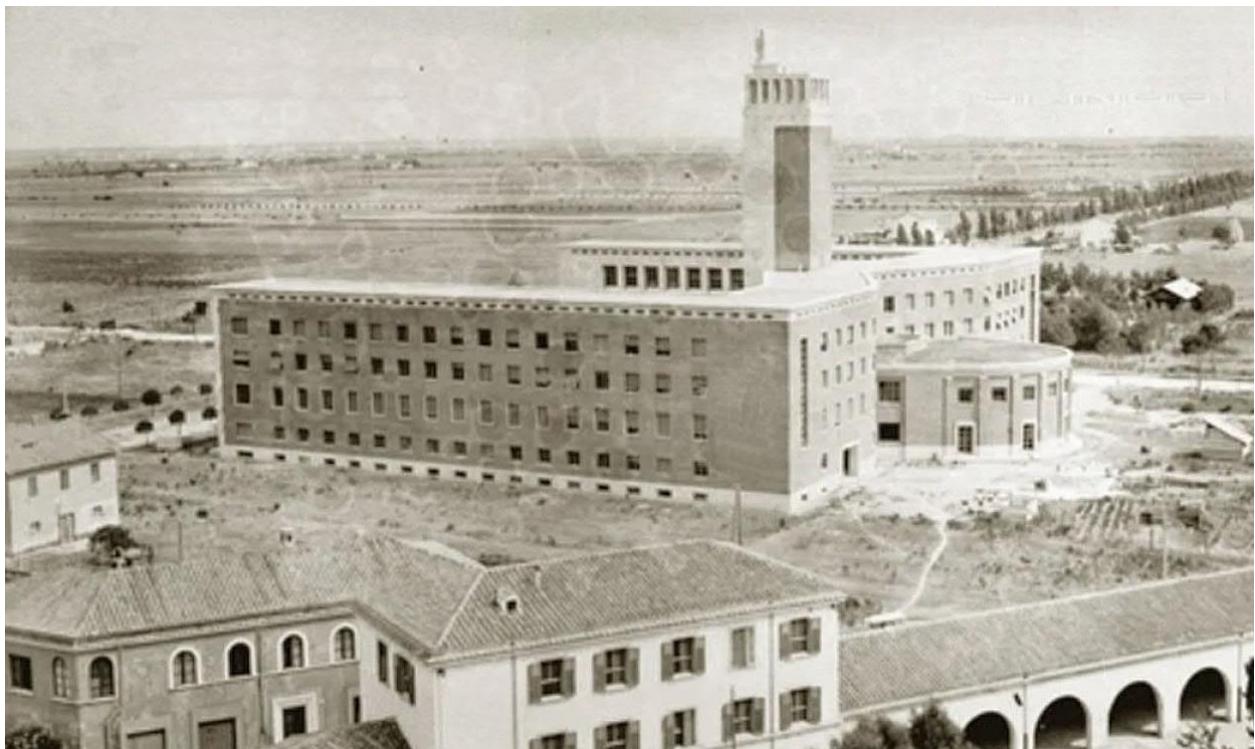
Immagine storica di Palazzo M prima dei bombardamenti del 1944