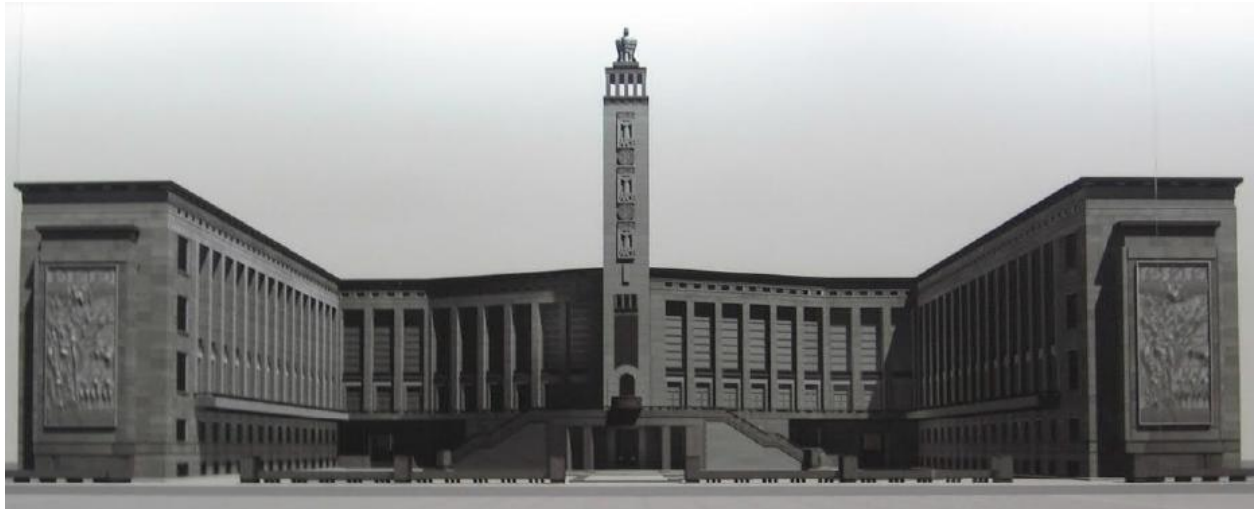
Rappresentazione dell'edificio secondo la versione di progetto originaria