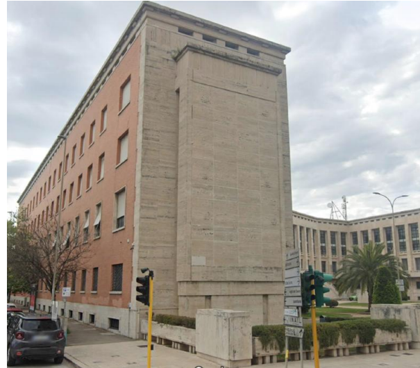
Stato attuale: vista del fronte su via Cialdini e dell'angolo tra la piazza e via XXI Aprile.