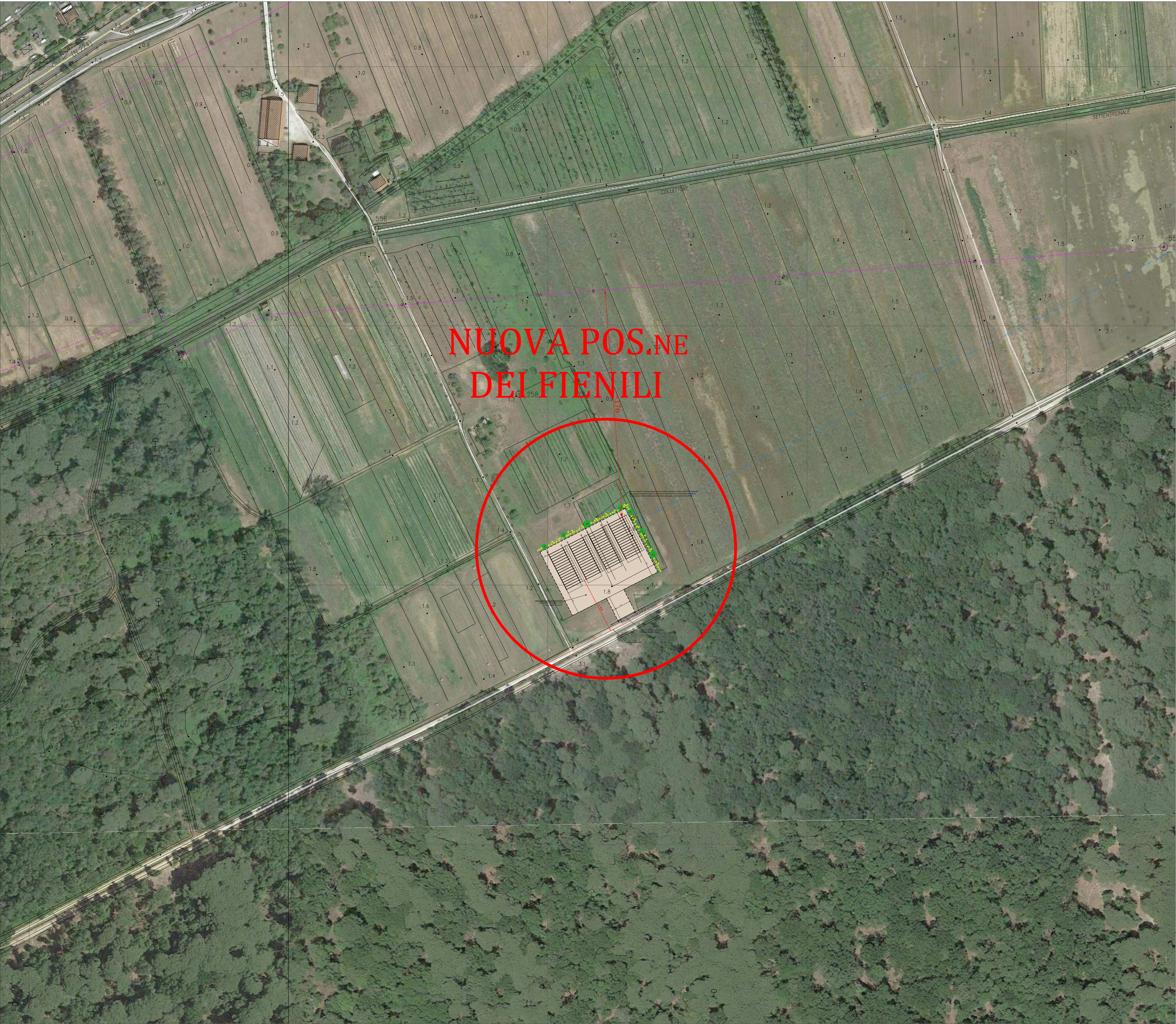
INQUADRAMENTO FIENILI scala 1:1000